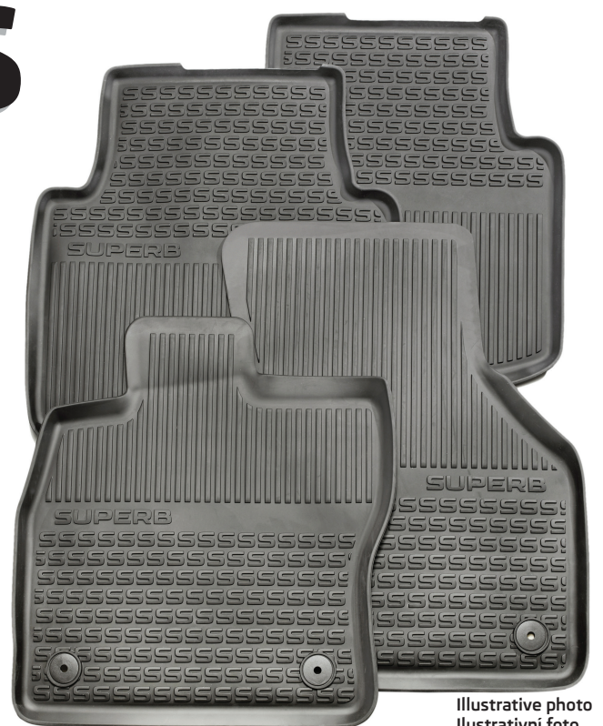
Illustrative photo Ilustrativní foto Illustrative Foto

2-piece set - rear/ dvoudílná sada - zadní/ 2-teiliger Satz - hinten